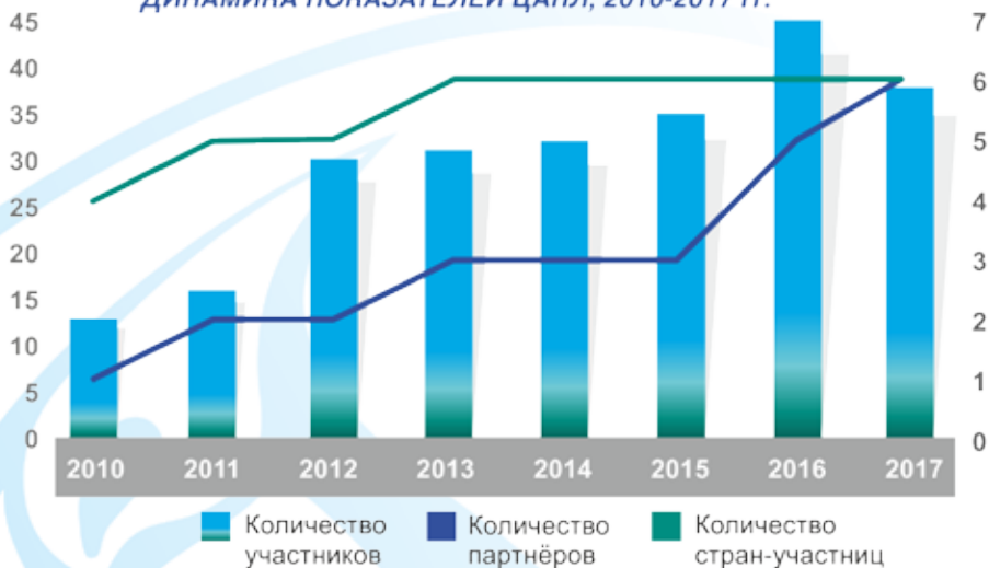
ДИНАМИКА ПОКАЗАТЕЛЕЙ ЦАПЛ, 2010-2017 гг.

Если Первая ЦАПЛ прошла в Астане в 2010 году с участием 13-ти человек, то Восьмая ЦАПЛ приняла 32 лидера и 6 выпускников, всего 38 участников. На сегодняшний день насчитывается уже более 230-ти выпускников ЦАПЛ по всему региону, в том числе, 16 выпускников ЦАПЛ - из Афганистана (Схема 1).